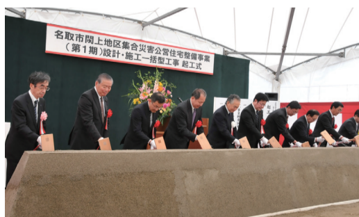
5月14日 関上復興公営集合住宅(1期)着工(名取市)