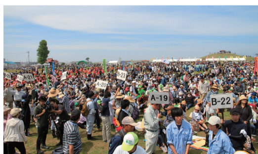
5月28日 千年希望の丘植樹祭(岩沼市)