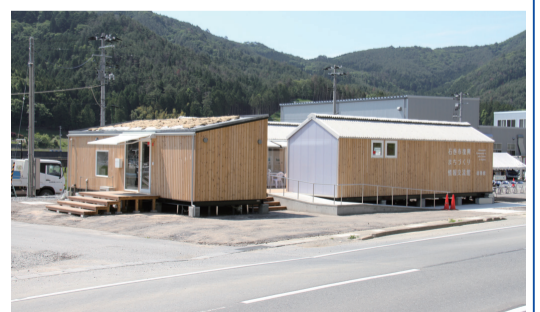
6月4日 復興まちづくり情報交流館雄勝館がオープン(石巻市)