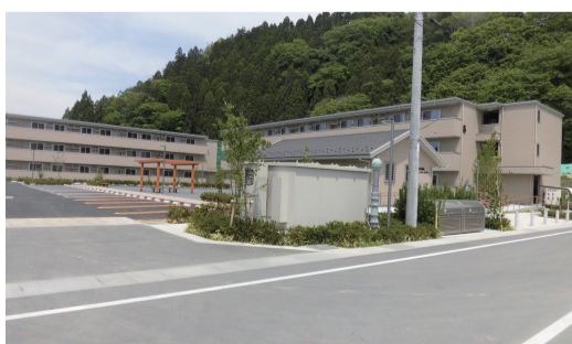
6月1日 切通地区住宅D工区で入居開始(気仙沼市)