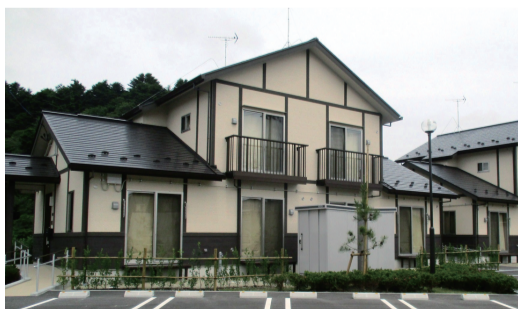
市営野蒜ヶ丘住宅（東松島市）