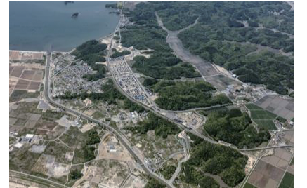
▲野蒜北部丘陵地区（東松島市）

最新の「復興の進捗状況」は、県ホームページでご覧いただけます。 http://www.pref.miyagi.jp/site/ej-earthquake/shintyoku.html