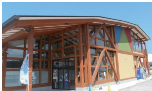
6月30日にオープンした『いしのまき元気市場』（石巻市）