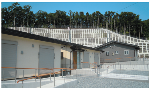
市営佐須浜復興住宅（石巻市）