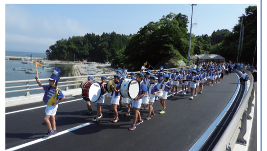
7月10日 国道398号線の新相川橋が開通（石巻市）