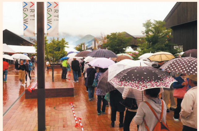
▲当日は雨が降っていましたが、大勢の来場者が会場を訪れました。