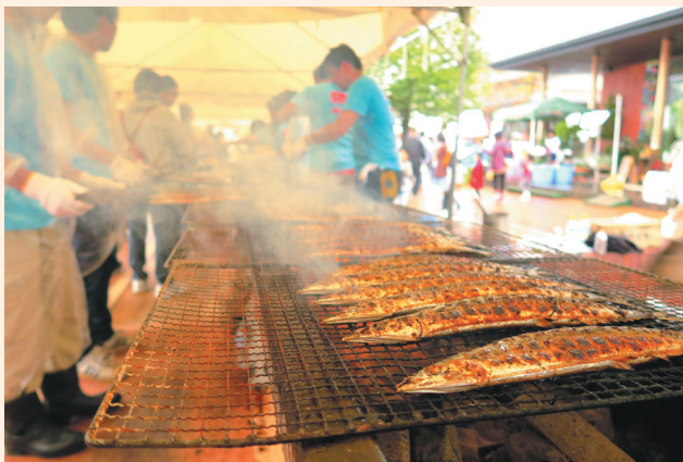
▲次々に焼かれる秋刀魚。会場内には秋刀魚の芳ばしい香りが立ち込めていました。

今年で21回目の開催となった「おながわ秋刀魚収穫祭」。震災があった2011年も、また、歴史的な秋刀魚の不漁年となった昨年でも中止をすることなく、女川の秋の風物詩として毎年開催されていました。今年も9月30日に開催され、会場となった女川駅前商業エリアには、大勢の観光客が訪れていました。来場者には、昨年同様、炭火焼きの秋刀魚10,000尾とすり身汁4,000杯が振舞われ(募金制)、会場は大いに賑わいました。集まった募金の総額は623,057円。この募金は海難遺児育英支援と災害被災地支援に充てられます。