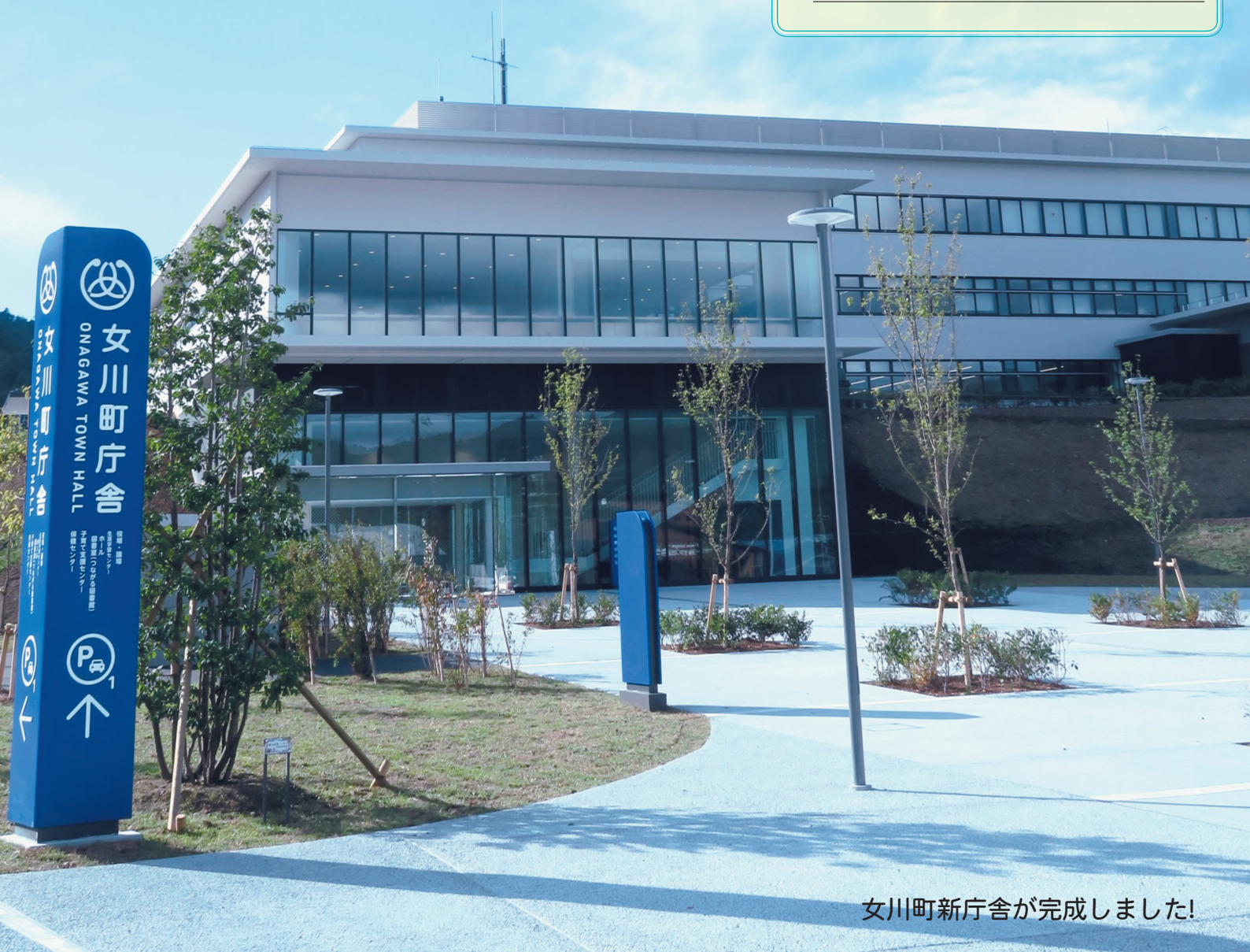
女川町新庁舎が完成しました!