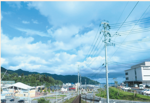
▲向かって左側が女川駅。右側が新庁舎。駅にほど近く、高台に建てられています。

生涯学習センターは412席のホールと蔵書8万冊の図書室からなり、ホールは災害時に支援物資の仮置き場としても活用されるなど、災害対策の拠点機能も備えています。また、原子力発電所の立地町として、放射線の防護設備が整備された災害対策室が庁舎2階に設けられました。