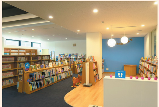
▲生涯学習センター内の図書室。絵本などの児童書もたくさんあります。