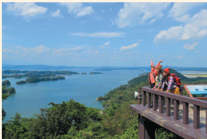
▲奥松島コース大高森からの眺望。

「気仙沼・唐桑コース」のオープニングセレモニーには約500人が、「奥松島コース」には約800人が参加し、雄大な景色を楽しみました。