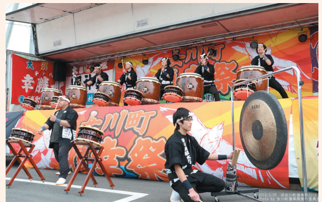
▲昨年開催された様子

◀「津波が来たら高台へ逃げる」という津波避難の基本を、何かの形で後世へ伝え続けたい…。女川町の民族伝承となるように育てていきたいとの思いから、この「祭」がスタートしました。JR女川駅付近をスタートし、高台にある白山神社を目指します。