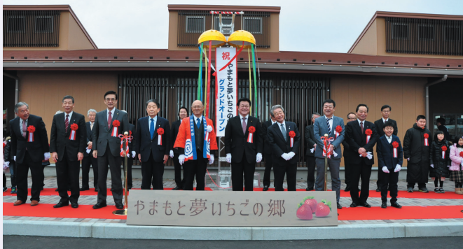
▲オープニングセレモニーの様子

オープニングセレモニーが行われた2月9日には多くの方が訪れ、一度に入店できる人数が制限されるほどの大盛況となりました。