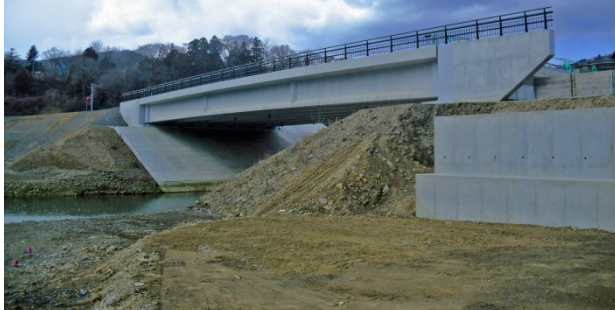
H29年6月1日より暫定供用開始