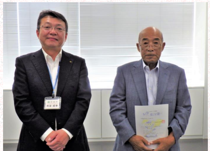
(左から舩谷所長，日野代表取締役)