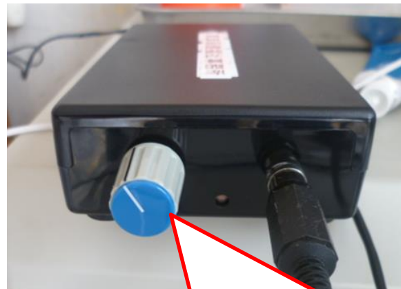
ポイントタッチスイッチの感度調整