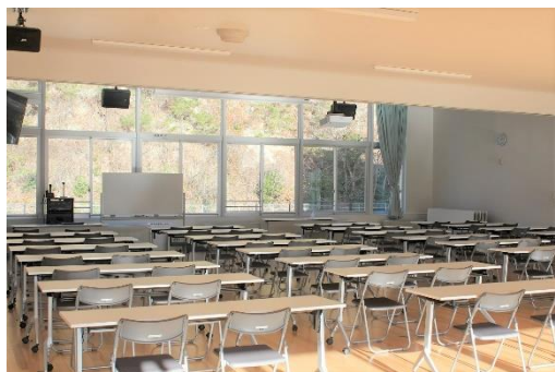
大型スクリーンのある研修室