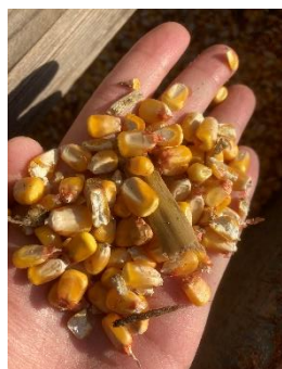
昨年、収穫された子実用トウモロコシ

家畜の重要な飼料である飼料穀物のほとんどは輸入されていますが、海外穀物市場は不安定さを増しており、価格が高騰しています。そこで飼料穀物の大半を占める子実トウモロコシを生産する取組が、国内でも始まっています。