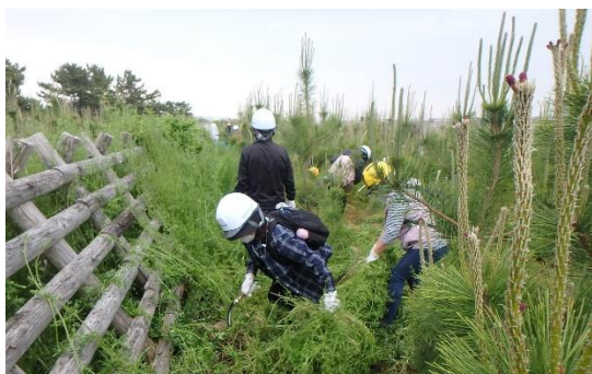
クロマツ林の保育作業