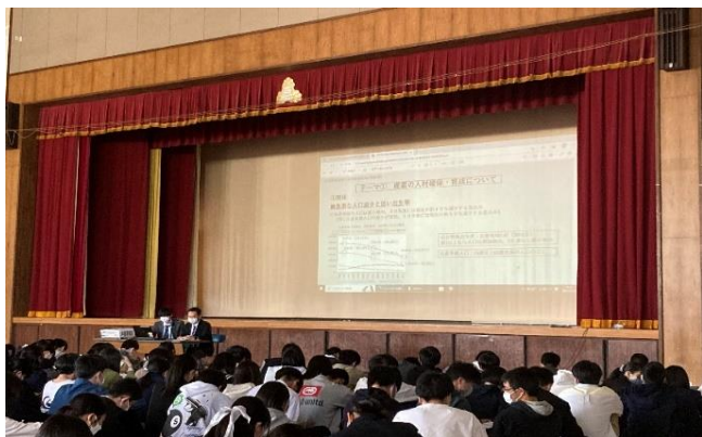
石巻高校向け地域課題説明会の様子

東部地方振興事務所では、石巻地域の現状と地域が抱える課題を生徒自らが探究し、その解決に向けた取組を検討・実施することで、生徒の地域貢献に関する意識の醸成を図り、将来、当地域で活躍する人材となることを目的とした取組を支援する事業を今年度立ち上げました。