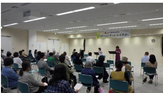
コンサートの様子

東部地方振興事務所では、合同庁舎が県民の皆様にとって身近で訪れやすく、地域に開かれたものにしていくため、令和2年度から30分間のミニコンサートを年8回程度開催しています。