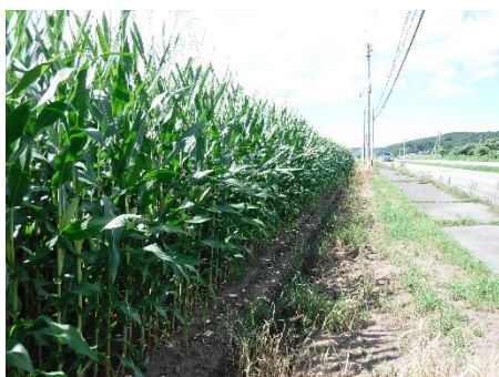
昨年の生育は順調です