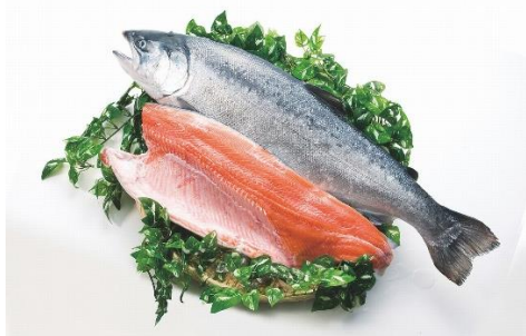
ギンザケ（みやぎサーモン）