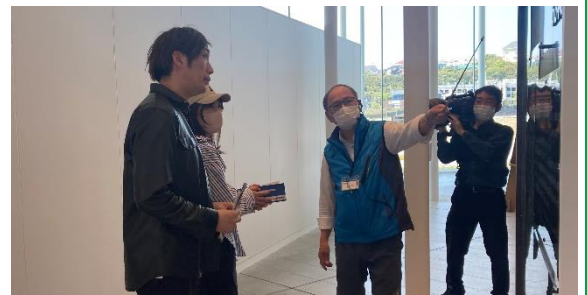
館内を御見学なさるお二人