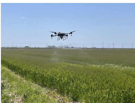
ドローンによる病害防除

県では、昨年度に県内広域を有効範囲とする RTK 基地局の整備を県内 7 か所で行い、令和 5 年 4 月から「宮城県 RTK システム」の本格運用をスタートしました。本システムは、GPS 等の人工衛星を利用した位置情報と、地上に設置した基地局からの補正情報を利用しており、スマート農業機械の位置情報が数 cm の誤差で測位可能となります。本システムにより、トラクターや田植機、コンバイン、ドローン、ブームスプレーヤー等の高精度な自動航行が可能となり、省力化、軽労化を図ることができます。効率的な農作業による燃料代や農薬代の節減、農業未経験者や新規就農者でも熟練者並みの操作が可能となるなどの効果も期待されています。