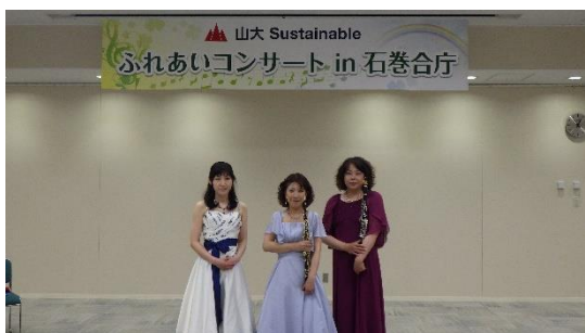
アンサンブル♪フェリーチェの皆さん

5月17日(水)に令和5年度第1回「山大 Sustainable ふれあいコンサート in 石巻合庁」を開催し、オーボエ・クラリネット・ピアノのアンサンブル「アンサンブル♪フェリーチェ」の皆さんが出演しました。昭和歌謡メドレーや映画・テレビのテーマソングなど、耳馴染みのある音楽をたくさん披露していただき、老若男女問わず楽しめる素敵な演奏に会場からは惜しめない拍手が送られました。