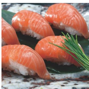
みやぎサーモンのお寿司

宮城県が生産量全国トップを誇る「ギンザケ」。水揚げの際に、“活け締め”や“神経締め”といった高鮮度保持処理が施されたものは「みやぎサーモン」のブランド名で流通し、国の地理的表示保護制度（GI）にも登録されています。