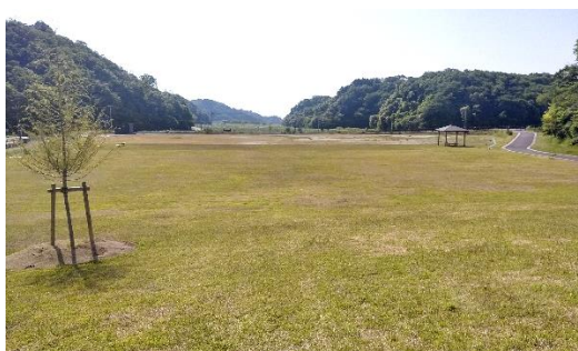
フットサルコートと運動場

「松島自然の家って、野蒜にあった野活（やかつ）でしょ。小学校の合宿で行ったよね。」