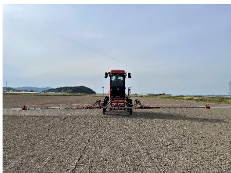
ブームスプレーヤーによる除草剤散布