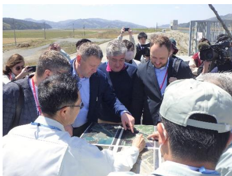
「大川地区」での説明の様子