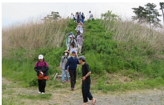
トレイルウォーキングの様子

震災からの復旧が完了した海岸防災林では、健全な生育のための保育の時期を迎えています。地域の皆さんに海岸防災林を身近に感じ関心を持ってもらうため、令和3年から「海岸林に親しむイベント」を実施しています。（R5.5.19（金）開催、会場：大曲県有防災林、参加者数62名、大曲まちづくり協議会・東松島市・東部地方振興事務所の共催）