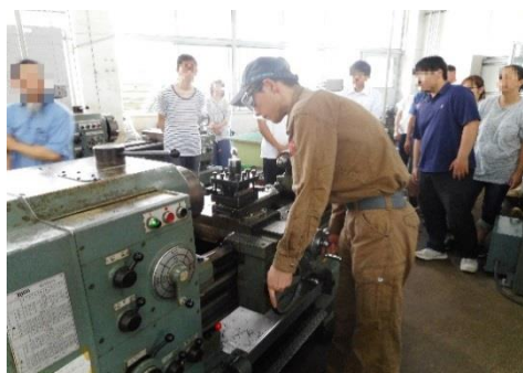
旋盤で金属材料を削る実演（金属加工科）