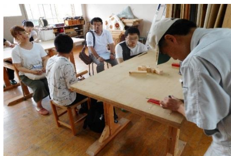
かんなで木材を削る実演（木工科）

7月20日（土）と8月30日（金）に石巻高等技術専門校で、オープンキャンパスを行います。（両日とも午後1時から）