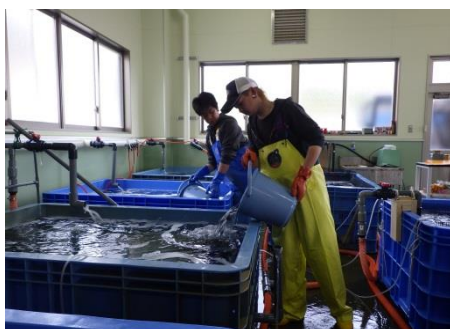
ホシガレイ種苗を水槽に収容