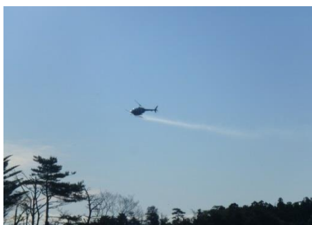
ヘリコプターによる薬剤散布状況