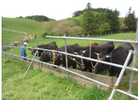
群毎に繋留し環境に適応させた後放牧される

石巻市河北地区の上品山放牧場で5月20日、牛の放牧が始まりました。初日は市内の畜産農家17戸が黒毛和種の繁殖雌牛48頭を預けました。当日の朝、牛を積んだ運搬車が順次牧場に到着すると、市や県の職員及び獣医師が立会いのもと、1頭毎に健康状態を確認し、パドックに群分けして繋留した後、上品山の西南に広がる標高約400mにある放牧区に放されました。