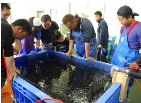
水槽に収容した種苗の観察