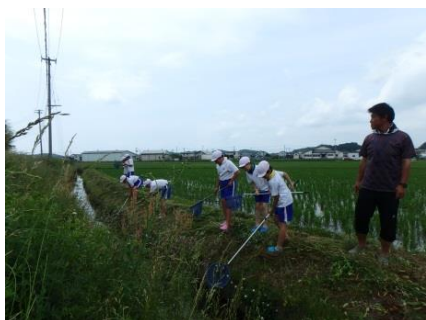
生き物調査の様子