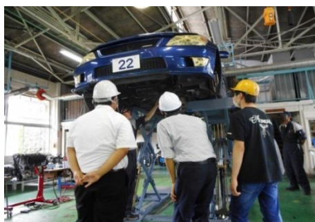
自動車のシャシを解説（自動車整備科）

オープンキャンパスでは、各科で行っている日々の訓練について、指導員と学生たちが体験と見学を通して分かりやすく解説します。将来、