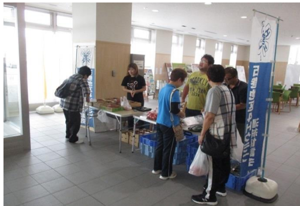
野菜の直売を通じて、お客様と交流を図りました。

石巻地区4 Hクラブは、5月28日に石巻合同庁舎1階ロビーにおいて、直売イベント「青空市」を開催しました。4 Hクラブとは若手農業者の集まりで、日頃から視察研修、農業経営課題の解決に向けた取組や発表を通じて他地域のクラブとの交流等を行い、会員の技術研鑽に努めています。その活動の一環として、会員が生産した野菜などを持ち寄って定期的に青空市を開催し、消費者の方と交流することによって実践的な販売力や接客力の向上に努めています。