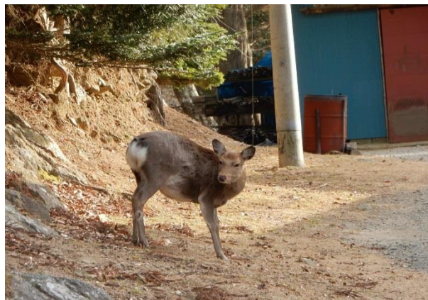
民家に出没したニホンジカ

石巻地域では、牡鹿半島を中心に、ニホンジカの増加による農林業被害や車両との接触事故などの被害が深刻化しています。このため、県では、市町及び猟友会等の狩猟者と連携し、増加したニホンジカの捕獲等の対策に取り組んでいます。