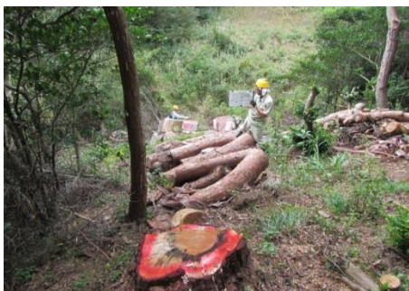
松くい虫被害木の伐倒駆除

県は各市町と連携し、6月18日から19日にかけて、宮戸（東松島市）、出島（女川町）、網地島及び田代島（石巻市）において、松林を松くい虫被害から保全するため、ヘリコプターによる薬剤の空中散布を実施しました。