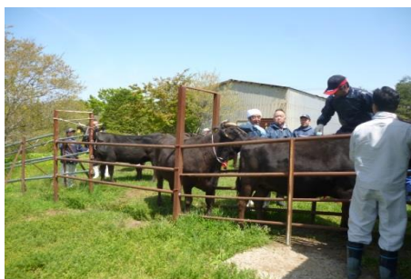
1頭毎に健康状態を確認