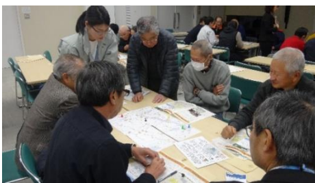
協力して動物を捕獲するボードゲームを体験