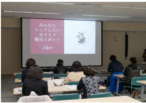
外国人観光客へのおすすめスポットの説明