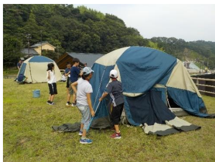
テント設営に挑戦する子どもたち