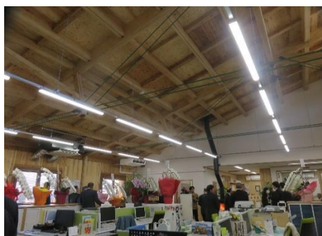
ATA ハイブリット構法