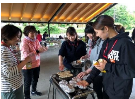
和気あいあいのクッキング

松島自然の家（旧名：松島野外活動センター 通称：ヤカツ）はかつて東松島市野蒜海岸にありましたが、東日本大震災の津波により甚大な被害を受け、同市宮戸島に移転しました。宿泊棟及び体育館は建設中で、令和3年4月から使用を開始する予定です。現在は野外活動フィールドのみの運営ですが、年々多くの皆様にご利用いただいています。令和2年度も下記3事業を行いますので、ぜひご利用ください。詳しいメニュー等は当所HPに掲載しています。