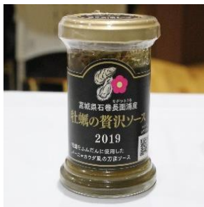
農林水産大臣賞受賞品 「牡蠣の贅沢ソース 2019」

宮城県水産加工品品評会は、本県の代表的な地場産業である水産加工業の振興に寄与するため、宮城県水産加工研究団体連合会等の主催により毎年行われています。