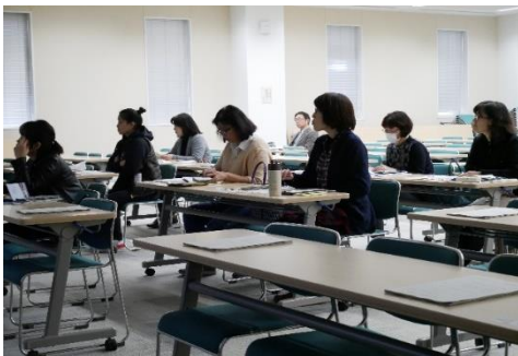
説明を聞く外国人観光客案内ガイドのみなさん

2月16日、石巻合同庁舎において「外国人観光客案内ガイド研修会」を開催しました。外国出身者や外国語に精通した日本人を対象に、これまで当事務所が養成した外国人観光客案内ガイド32名のうち7名が参加しました。