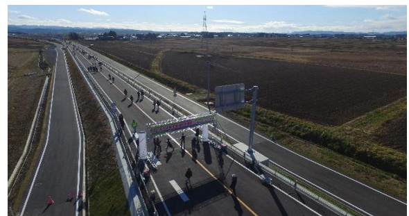
参加者全員、無事ゴールできました。