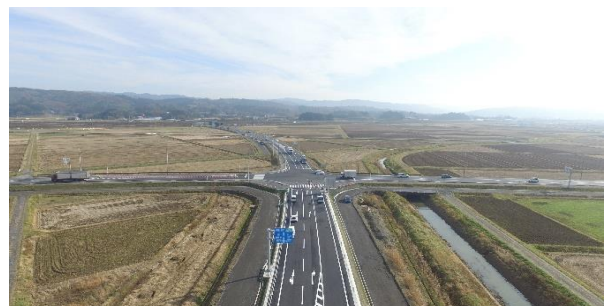
登米中田交差点 (H30.12月撮影)