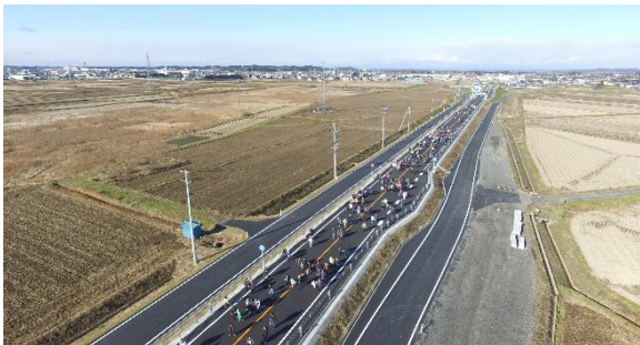
当日は天候にも恵まれウォーキング日和でした。