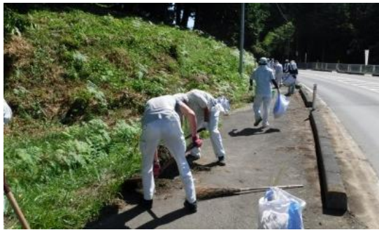
(主)古川佐沼線での作業の様子

また、日頃から道路美化活動をボランティアで実施されているスマイルロードサポーター8団体が各認定区間で清掃等を行いました。