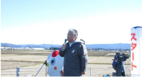
登米市長より開会の挨拶をいただきました。