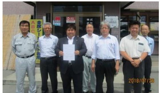
株式会社佐沼生コン さま