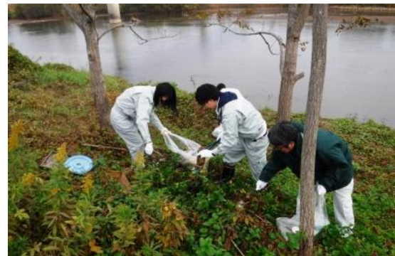
全体で1,215kgの一般ゴミを回収しました。