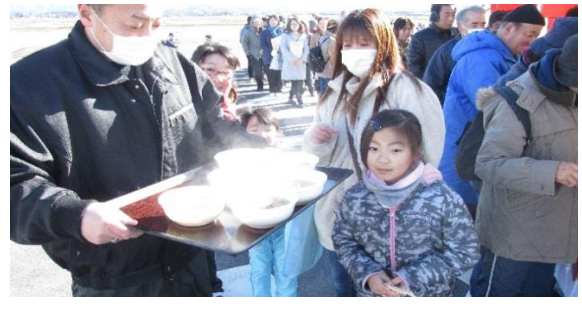
中田工区工事安全協議会より、登米市名産「はっと汁」が振る舞われました。