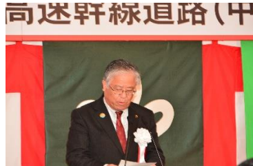
挨拶：登米市長 熊谷盛廣