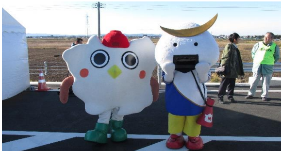
「むすび丸」, 「はっトン」も来ました。