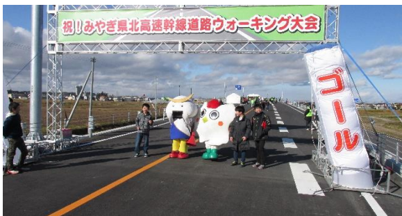
「むすび丸」, 「はっトン」と記念撮影。 子供たちに大人気でした！！