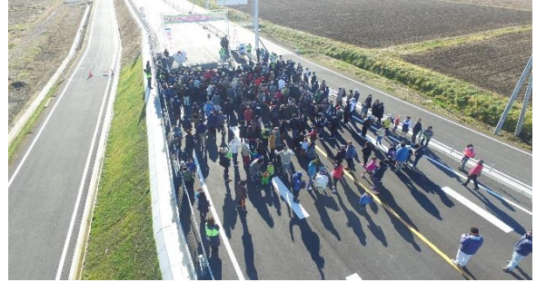
約300名の参加者がウォーキングに参加しました。