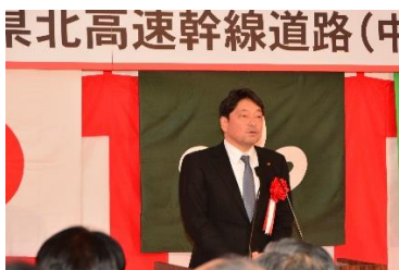
祝辞：衆議院議員 小野寺五典 さま