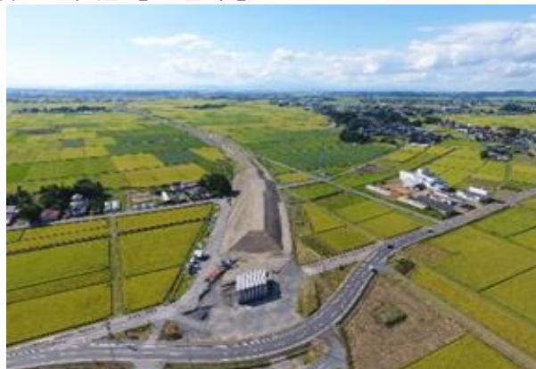
H28県債地道改復興3-A01号 みやぎ県北高速幹線道路（中田工区） 道路改良（その1）工事 登米市中田町宝江地内外