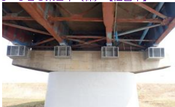
H29社道復興橋補12-32-A02号 二ツ屋橋外橋梁耐震補強工事 登米市豊里町外一番江地内外