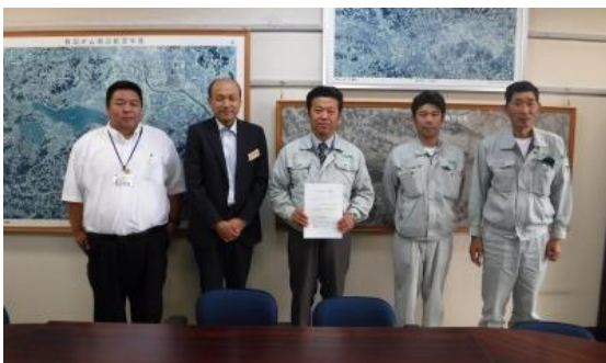
株式会社高節土建クリーナーズ さま