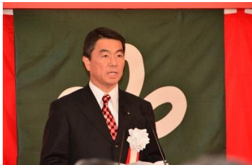
挨拶：宮城県知事 村井嘉浩