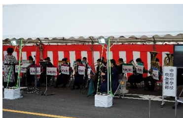
中田中学校による吹奏楽演奏