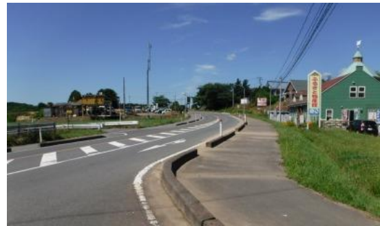
すっかりきれいになりました！