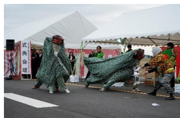
長谷観世音虎舞保存会 による虎舞披露