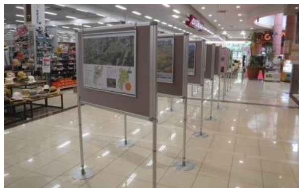
パネル展示の様子