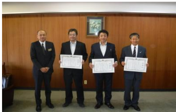
左から当所所長、ウジエスーパー南佐沼店さま、仙北信用組合迫支店さま、日下金物店さま