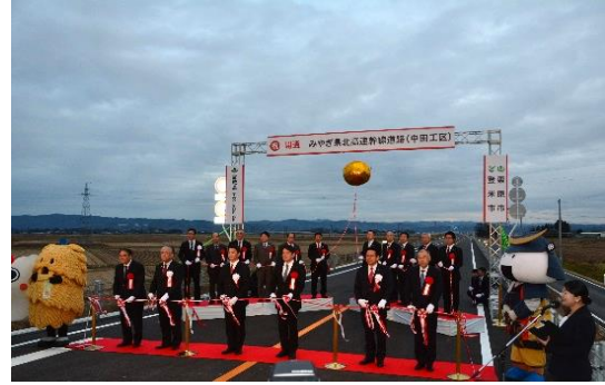
テープカット及びくす玉開披