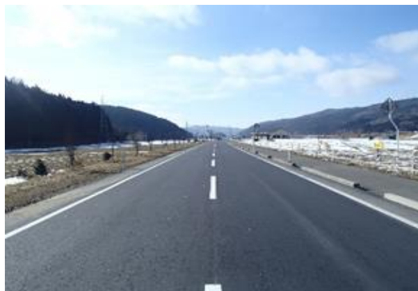
H29県舗補05001-A01号 米川舗装補修工事 登米市東和町米川字新中田地内