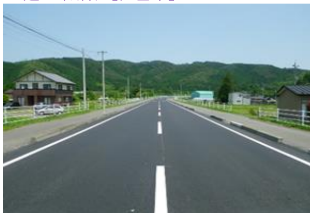
H29社道防安19-218-A01号 米川舗装補修（その2）工事 登米市東和町米川字中嶋地内