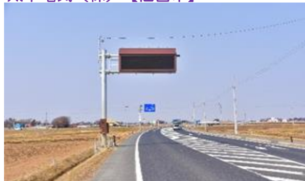
H28県債地道改復興3-A08号 みやぎ県北高速幹線道路情報表示板設置工事 登米市中田町宝江地内外