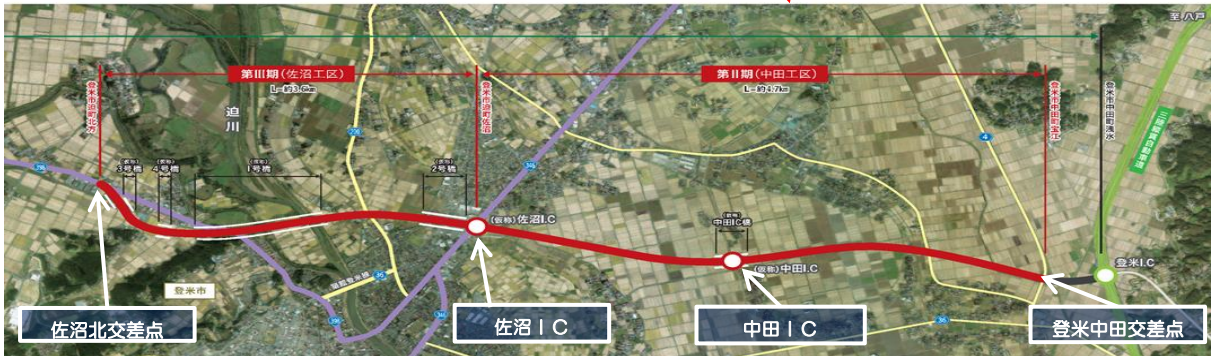
みやぎ県北高速幹線道路(Ⅱ期中田工区・Ⅲ期佐沼工区全体図)