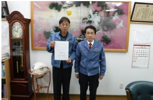
株式会社鈴亀建設 さま