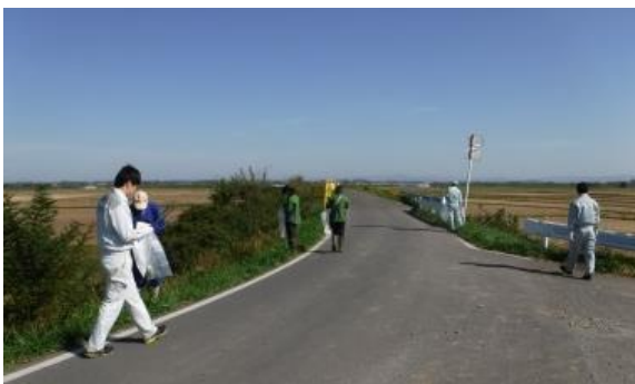
蕪栗沼周辺の清掃活動

大崎市田尻観光協会主催による「蕪栗沼クリーン作戦」が10月22日（月）に実施され、事務所からも4名の職員が参加し、蕪栗沼と周辺水田の清掃を行いました。