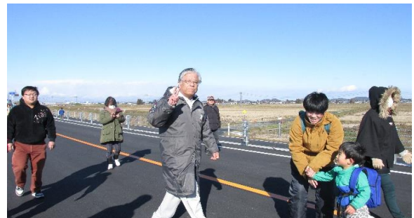
登米市長もウォーキングに参加しました。