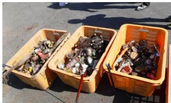
多くの空き缶などを回収しました。